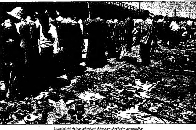
عراقيون يبيعون هياكلهم في سوق بغداد، امس